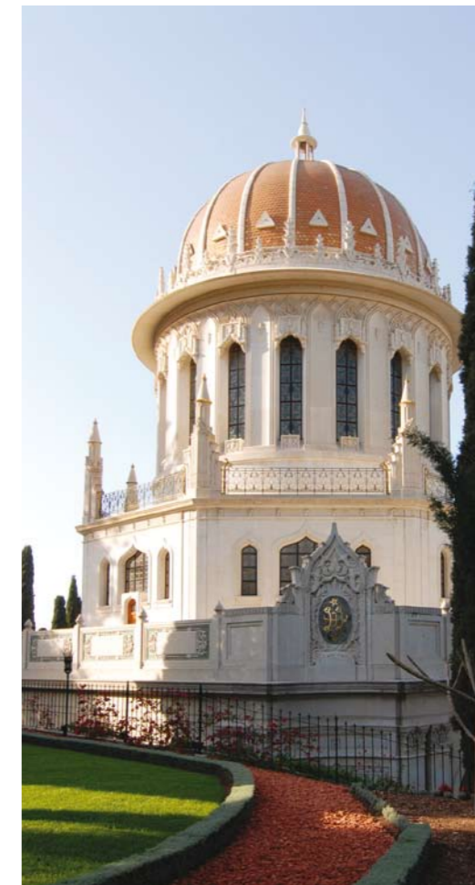
Der Schrein des Báb

A ufgabe der Religion ist es, die Entwicklung der Menschen zu fördern und soziale Gerechtigkeit zu verwirklichen. Dazu ist oft auch konkrete praktische Unterstützung nötig. Die Bahá'í führen dafür weltweit eine große Zahl von Projekten der sozialen und wirtschaftlichen Entwicklung durch (derzeit über 11.600). Die direkte materielle Hilfe ist dabei nur von untergeordneter Bedeutung. Entscheidendes Kriterium für Hilfsprogramme der Bahá'í ist es in der Regel, dass eine Grundlage gelegt wird für eine weitere Entwicklung ohne Hilfe von außen. Erziehung und Ausbildung spielen deshalb bei diesen Projekten besonders häufig die wichtigste Rolle. So werden die Menschen in die Lage versetzt, ihr eigenes Leben besser zu meistern. Auch Programme für Hygiene und Gesundheit zielen in diese Richtung. Dazu kommen zum Beispiel Projekte im Agrarbereich oder für die Dorfentwicklung.