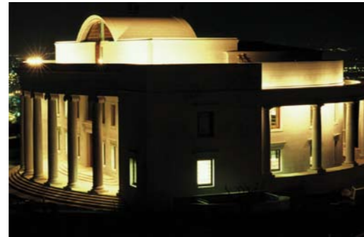
Das Internationale Lehrzentrum bei Nacht ▼

Jeden Tag wenden sich die Gläubigen auf der ganzen Welt während ihres Pflichtgebets dem Grabmal Bahá'u'lláhs zu.