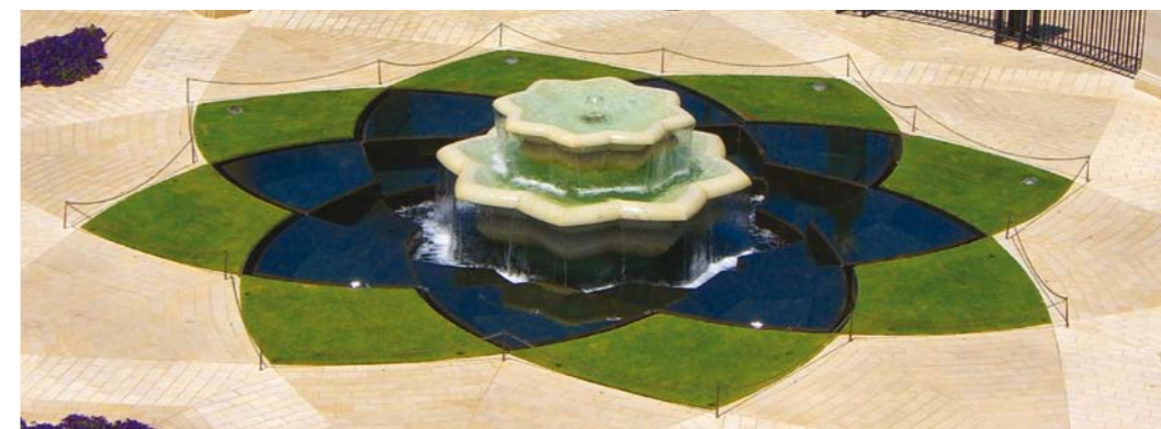
1. Terrasse vom Schrein des Báb

Nach Auffassung der Bahá'í haben sich mit dem Kommen Bahá'u'lláhs die alt- und neutestamentarischen Verheißungen erfüllt. Die Lehren der Gottesoffenbarer stimmen in ihren Grundzügen überein. Bahá'u'lláh erfüllt sie mit neuem Leben und ergänzt sie durch solche, die der Stufe der bevorstehenden Reife der menschlichen Gesellschaft angemessen sind.