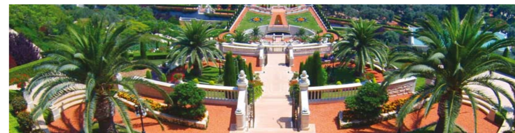
Das Bahá'í-Weltzentrum in Haifa