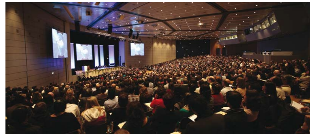
◀ Bahá'í-Konferenz in Frankfurt im Februar 2009 mit mehr als 4000 Teilnehmern