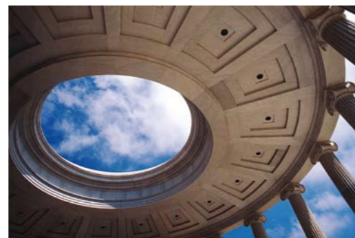
Eingang zum Zentrum für das Studium der Schriften ▼

Jeden Tag wenden sich die Gläubigen auf der ganzen Welt während ihres Pflichtgebets dem Grabmal Bahá'u'lláhs zu.