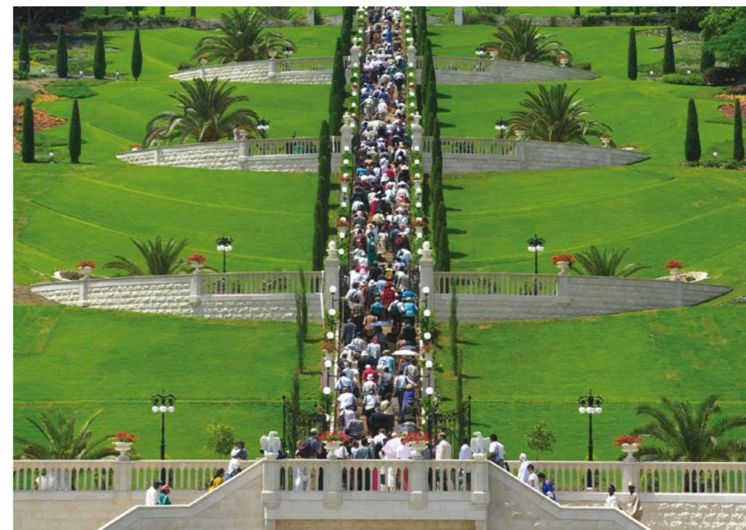
▲ Bahá'í aus der ganzen Welt beschreiten zum ersten Mal die Terrassen am Berg Karmel am 23. Mai 2001.

»Der Bahá'í-Glaube ist ein Trost für die Menschheit.«